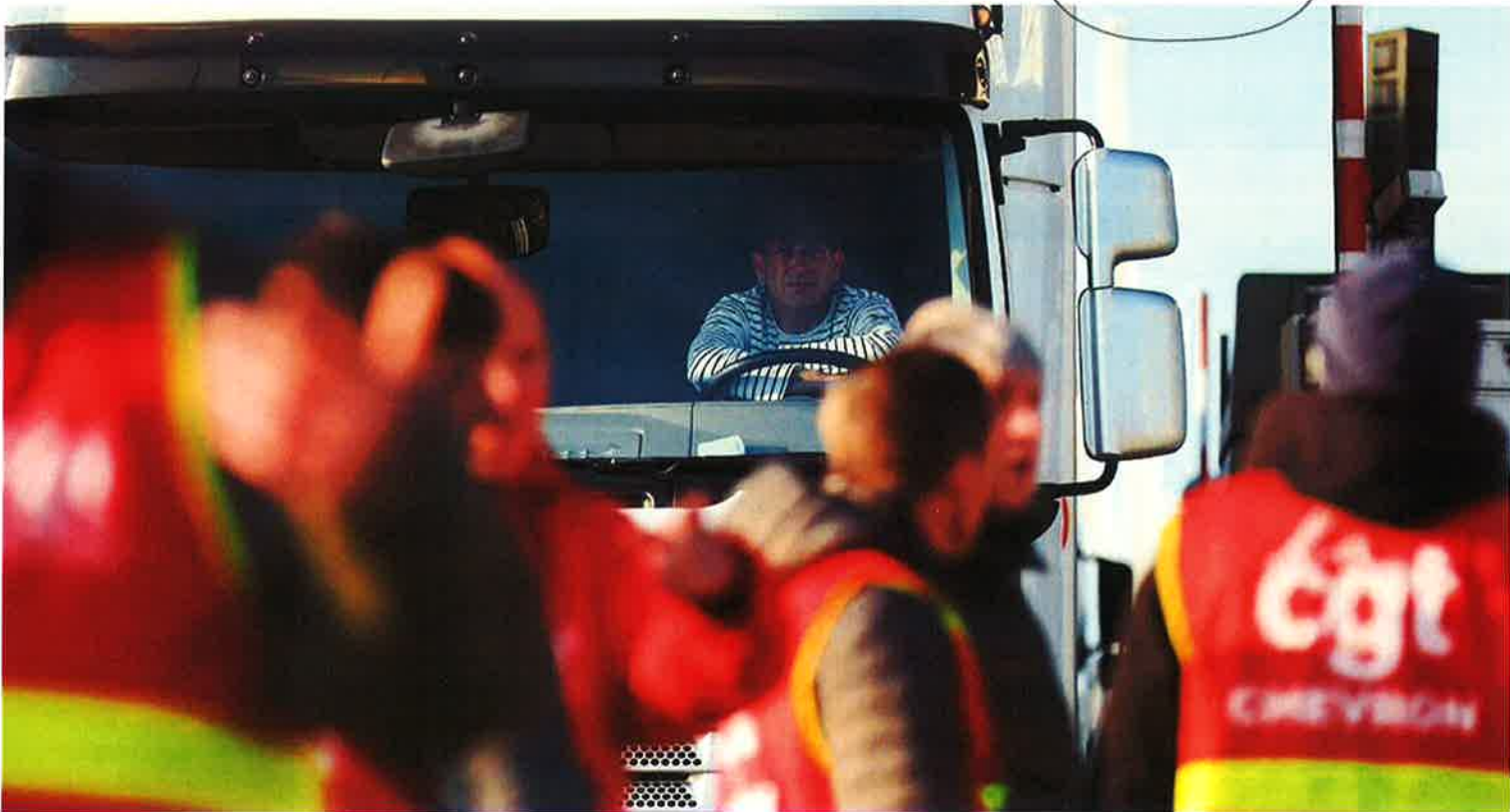
Des manifestants cégétistes bloquent l'accès des poids lourds au Pont de Normandie.

DOMINIQUE AUBIN (HTTP://WWW.LESECHOS.FR/JOURNALISTES/INDEX.PHP?ID=1223) | Le 15/06 à 07:00